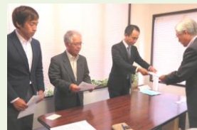
産廃問題で申し入れ

名水の里と豊かな環境、農水産物を守るため、産業廃棄物処分場の建設は絶対に認めません。基地被害や原