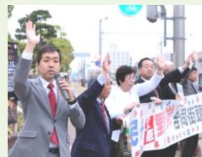
森県議らと「憲法守れ」